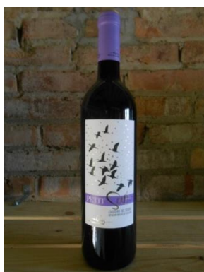
PETIT SAÓ MAS BLANCH I JOVÉ Preu: 7,5€