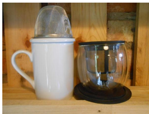
TASSES AMB COLADOR