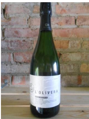
L'OLIVERA GRAN RESERVA BRUT NATURE COOP. L'OLIVERA Preu: 11,60€