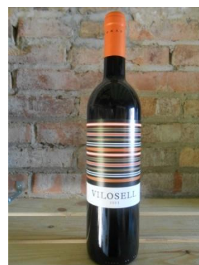
VILOSELL TOMÀS CUSINÉ Preu: 11,60€