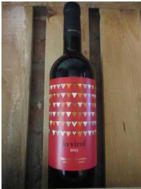
LO VIROL CERCAVINS Preu: 6,20€