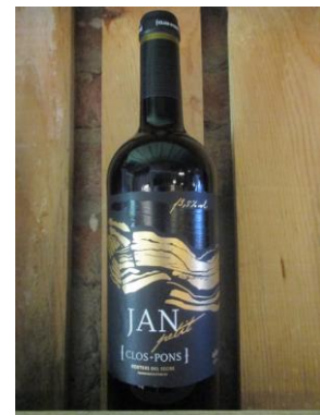
JAN PETIT CLOS - PONS Preu: 7.50€