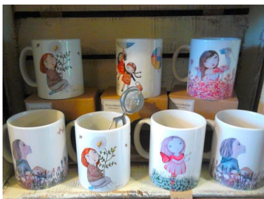
TASSES DISSENY MONTSE LLOP (Tàrrega)