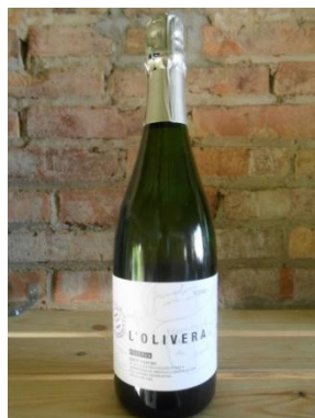
L'OLIVERA RESERVA BRUT NATURE COOP. L'OLIVERA Preu: 8,90€