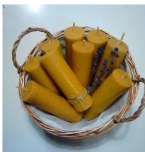
ESPELMES DE CERA D'ABELLA 100% NATURAL