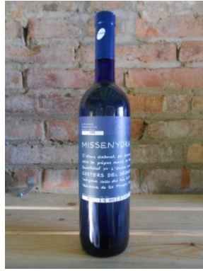
MISSENYORA (ecològic) COOP. L'OLIVERA Preu: 11,40€