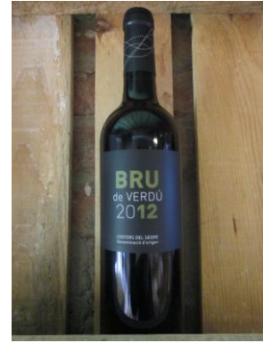
BRU DE VERDÚ CERCAVINS Preu: 10,00€