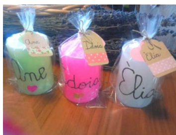
ESPELMES AMB EL NOM