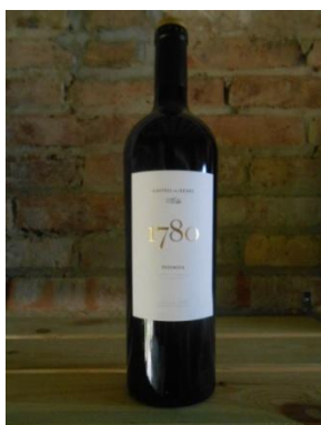
1780 CASTELL DEL REMEI Preu: 21€