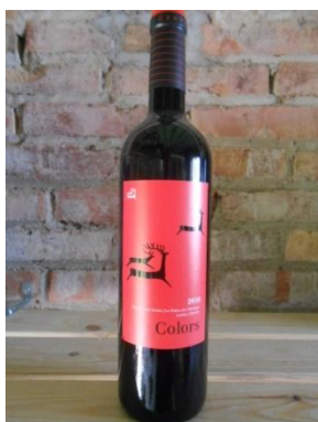
COLORS NEGRE CÉRVOLES Preu: 11,60€