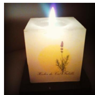
ESPELMES AMB LOGOTIP, FOTOGRAFIA, IMATGE..