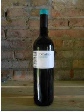
COMALATS 2013 (ecològic) COMALATS Preu: 13€