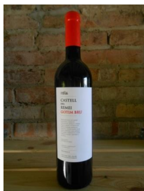
GOTIM BRU CASTELL DEL REMEI Preu: 7,60€