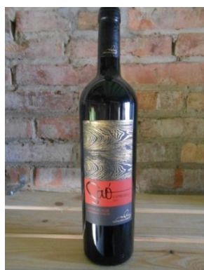
SAÓ EXPRESSIU MAS BLANCH I JOVÉ Preu: 17€