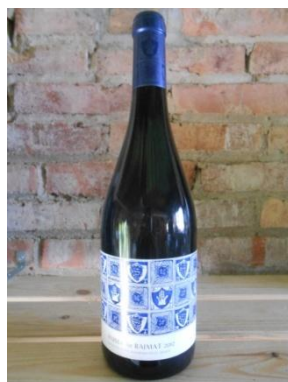
ÀNIMA DE RAIMAT RAIMAT Preu: 7,5€