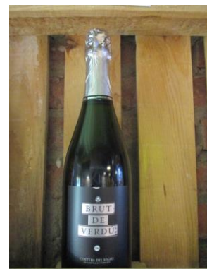
BRUT DE VERDÚ CERCAVINS Preu: 9.50€