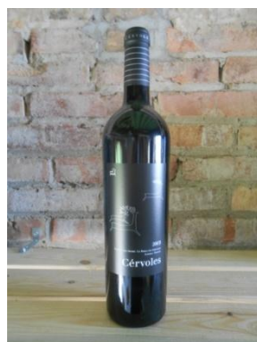
CÉRVOLES 2007 CÉRVOLES Preu: 19€