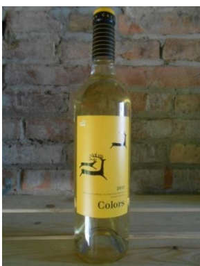
COLORS BLANC CÉRVOLES Preu: 7€